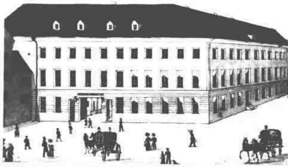
Das neue „Theater- und Gesellschaftshaus“, nach den Plänen von Emanuel von Herzogen erbaut, wurde durch eine Aktiengesellschaft finanziert.

"Stadttheater zu Regensburg - - italienische Einflüsse und Inspirationen - -"